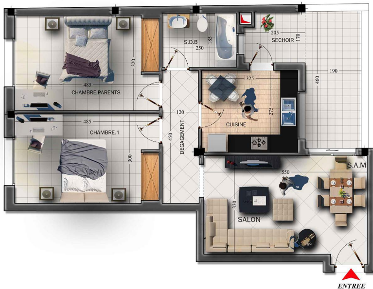
NIVEAU :2 Eme Etage