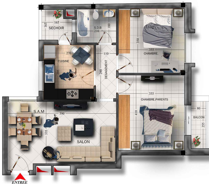
NIVEAU :2 Eme Etage