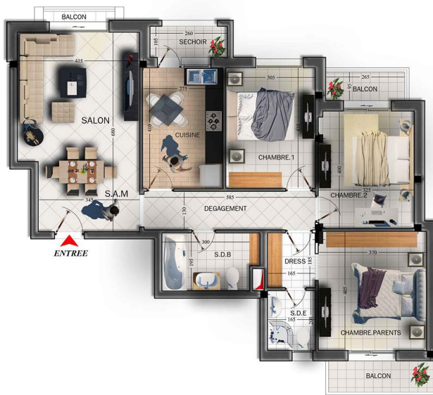
NIVEAU :2 Eme Etage