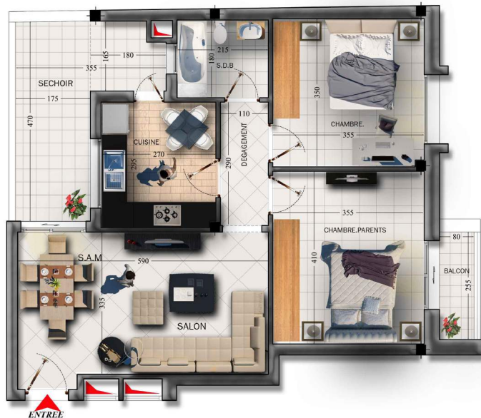
NIVEAU : 1 Er Etage